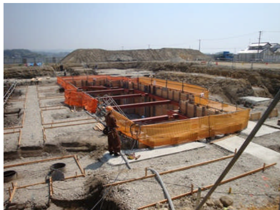
ステージ前の座席部分は床が下がるしくみ